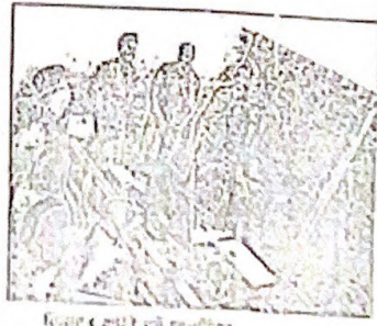
ਕਿਸਮਤ ਵਾਲੀ ਚੀ ਚਾਹਿਦਾ